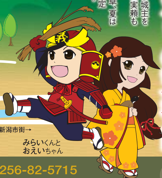
みらいくんとおえいちゃん

林道からの登り口付近には駐車場がありません。 ① 丸小山公園駐車場 ② 岩室駐車場 ③ 石瀨駐車場 をご利用ください。